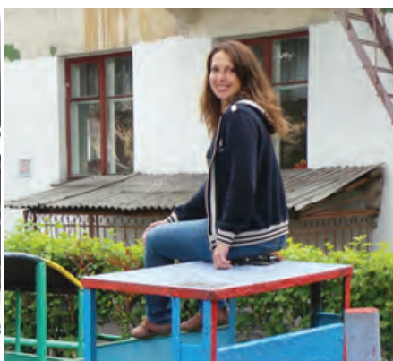
Фото: «Паровозик» в детском саду