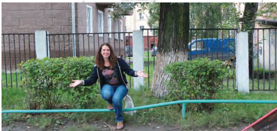
Фото: «На качелях»